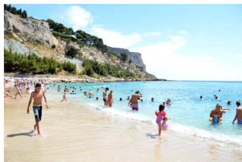
久しぶりの海水浴

団体の皆さんとの交流会も催され、国際的な人と人との繋がりを構築しつつ、また、福島の実状への理解を深めていただくという意味でも、大変貴重な機会となりました。